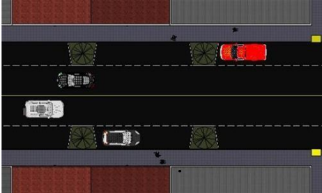
Espaço Árvore para calçadas no viário com no mínimo 2,00m de largura

Exemplo 2: Considerando uma calçada de 2,0m de largura, 2,0 \times 40\% = 0,80\text{m} de largura e o comprimento do espaço deverá ter no mínimo (\text{largura } 0,80\text{m}) \times 2 = 1,60\text{m} de comprimento.